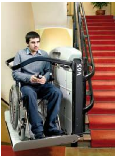
V65 гарантирует безопасность передвижения